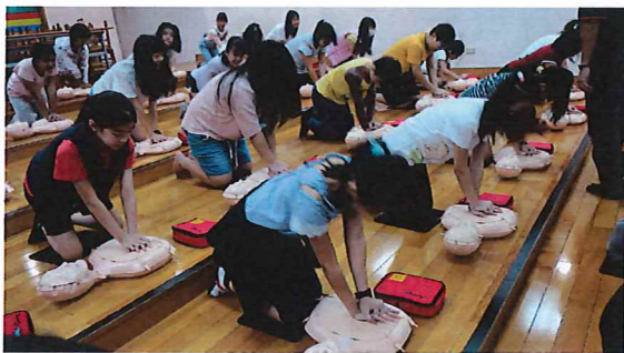
同學聽老師指示操作心肺復甦術