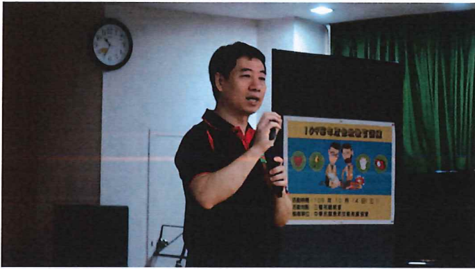
講師講述急救技能的重要性