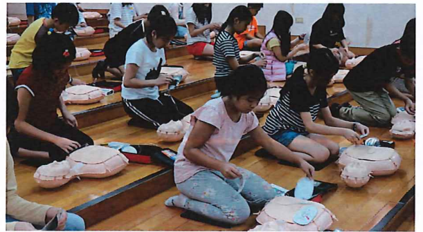
同學嘗試操作 AED，將電擊貼片貼在正確位置