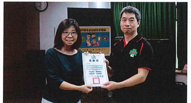
校長致贈感謝狀給講師