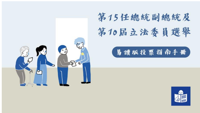
總統與副總統+立法委員選舉投票動線圖

這本手冊主要是提供給智能障礙者、文字閱讀能力有困難的人所使用的易讀版投票說明手冊,說明民國 109 年 1 月 11 日第 15 任總統副總統及第 10 屆立法委員選舉的投票流程,以及相關的重要資訊。